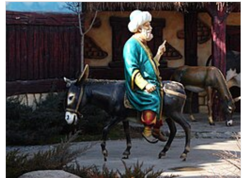
Nasr Eddin Hodja dans un parc à Ankara en Turquie.

Il est le fils de l'imam Abdullah Efendi et de Sıdıka Hanım 2 . Ses histoires ont parfois pour protagonistes le terrible conquérant Tamerlan ( Timour Lang ), pour qui il joue le rôle de bouffon insolent. Bien que les récits impliquant Tamerlan (Timour Lang) soient historiquement anachroniques, ils reflètent l'utilisation symbolique de figures historiques dans la tradition orale pour illustrer des traits universels, comme la résistance à l'autorité et l'humour face à l'oppression.