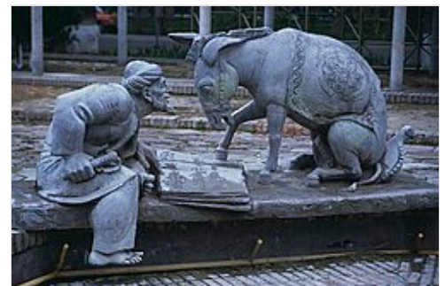
Statues de Nasr Eddin Hodja et de son âne à Samarcande en Ouzbékistan.