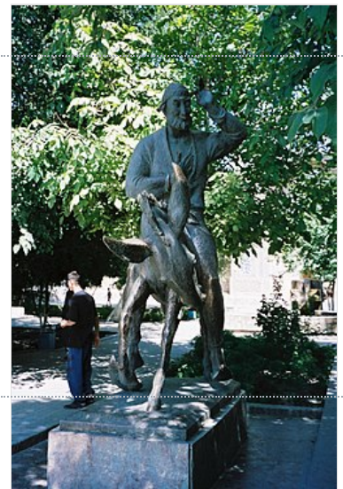
Statue de Nasr Eddin Hodja à Boukhara (Ouzbékistan).