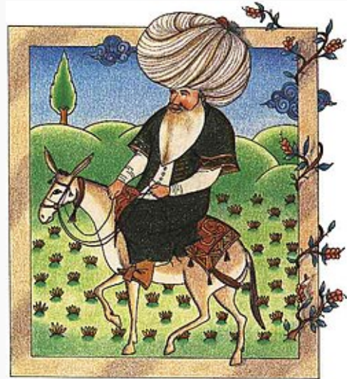
Miniature de Nasr Eddin Hodja (17 e siècle).