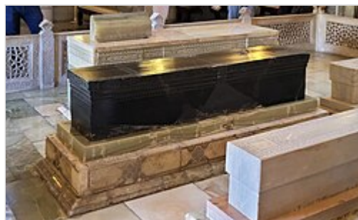
Tombe de Tamerlan dans le Gour Emir