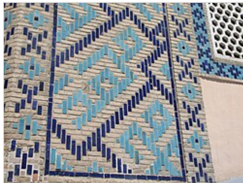
Détails de la décoration extérieure.

Intérieurement, le mausolée apparaît comme une grande pièce haute, richement décorée, comportant des niches profondes sur les côtés. La partie inférieure des murs est couverte par des dalles d' onyx d'un seul tenant. Chacune de ces dalles est décorée de peintures raffinées. Au-dessus de ces panneaux court une corniche de mocárabes en marbre. Les murs sont décorés d'enduits peints. Les voûtes et la coupole intérieure sont ornés par des cartouches en papier mâché, peints et dorés.