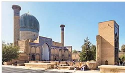
Le Gour Emir